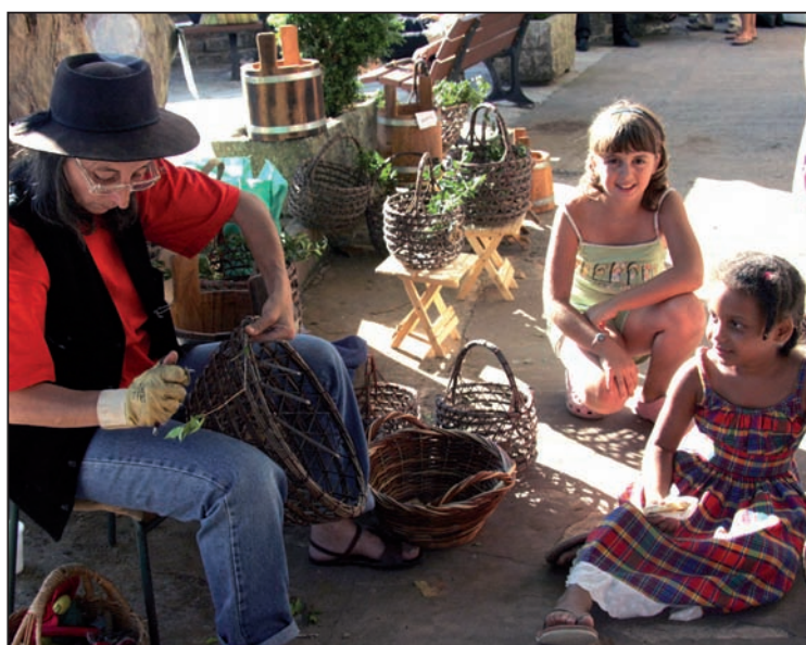
L'artisanat, le goût et la culture se conjuguent à tous les temps, chaque lundi à Peru Casevechje