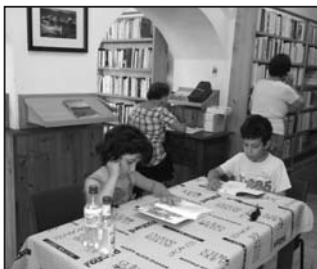
Deux jeunes lecteurs du village